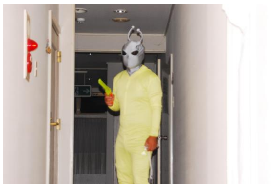
コーチたちは準備態勢へ