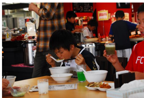
ラーメンよりの「アイス」や「ジュース」ばかりの食べ放題でした。