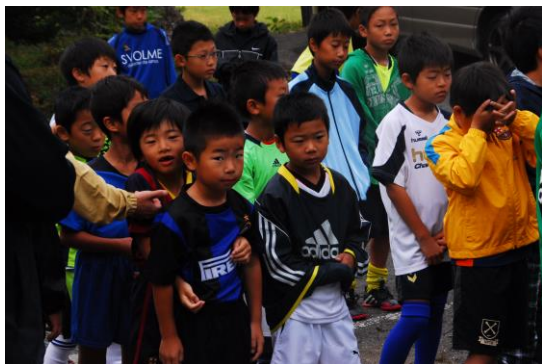
みんなとっても眠い顔です(笑)