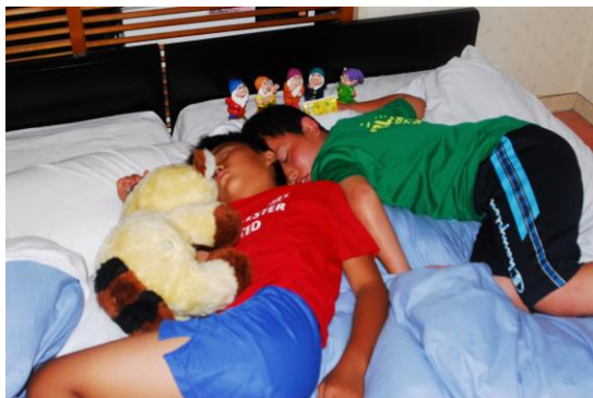
さすがに、二日目の夜はみんな爆睡です(笑)