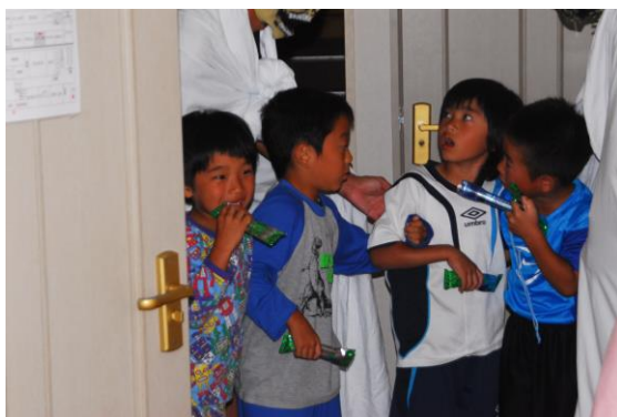
4人組で手をつなぎながら進もう！