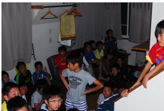
順番を待っている不安そうな顔・・・