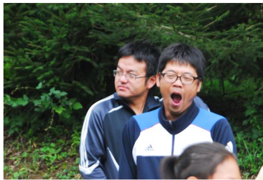
コーチたちにも疲れが・・・